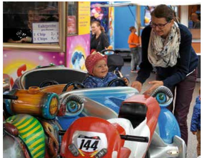
Kleine und große Gäste freuen sich auf den Vergnügungspark.

In vielen Stuben in Güglingen wird geplant, telefoniert und gearbeitet. Denn es sind nur noch drei Wochen bis zum Maienfest. Auch in diesem Jahr gibt es einen Vergnügungspark mit vielen Attraktionen für große und kleine Besucher. Ein Riesentrampolin wird den Festplatz bereichern, außerdem die Fahrgeschäfte Jump Street, Scooter, Round Up. Für kleine Gäste gibt es ein Kinderkarussell und einen Babyflug. Softis, Crêpes und gebrannte Mandeln sowie die Gollerthan-Imbissbude sorgen auf dem Festplatz für das leibliche Wohl. Aktivstände laden ein zu Sportschießen, Entenangeln, Ballwerfen, Soccer sowie Liebesbarometer, Greifer und Boxer. Zum Festauftakt am Freitag, 17. Mai, öffnet der Vergnügungspark um 17.00 Uhr. Am Samstag, 18. Mai, öffnen die Schausteller bereits um 13.00 Uhr, am Pfingstsonntag und Pfingstmontag können die Gäste bereits von 11.00 Uhr an die Fahrgeschäfte und Buden besuchen.