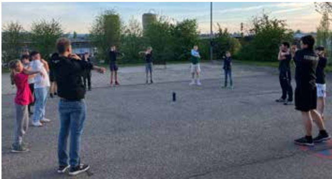
Beim Frühsport durfte das Dehnen nicht fehlen.

durften die jungen Mitglieder mit 4 C-Strahlrohren hantieren und konnten das Feuer schnell „unter Kontrolle“ bringen. Auf Wunsch der Jugendlichen gab es zum Mittagessen Hamburger vom Grill mit Pommes, was allen geschmeckt hat. Müde und zufrieden konnten nach den gemeinsamen Aufräumarbeiten und einem leckeren Eis zum Abschluss alle in den wohlverdienten „Feierabend“ gehen.