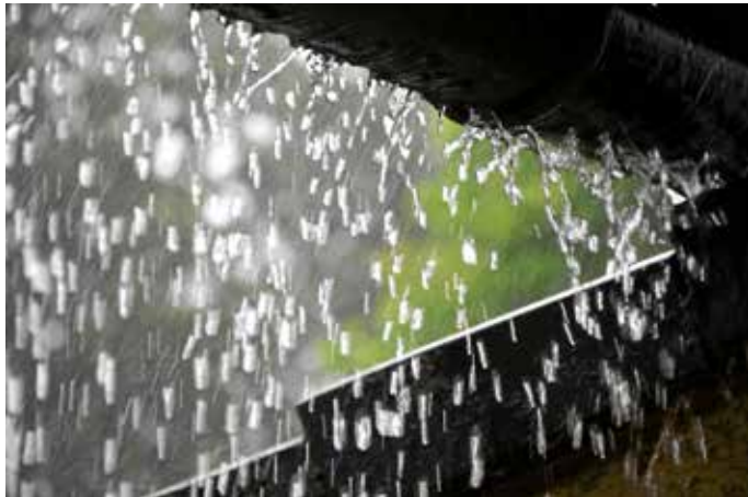
Der deutsche Wetterdienst warnt in drei Stufen vor Starkregen.

Die Stadtverwaltung hatte ein größeres Interesse bei dem Thema erwartet, deshalb hat die Bürgerversammlung zum Starkregenisikomanagement in der Blankenhornhalle stattgefunden, zu der knapp 50 Einwohner erschienen sind.