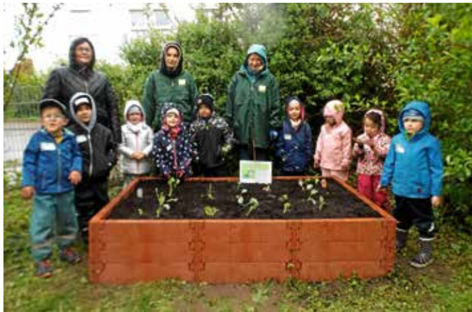
Das bepflanzte Hochbeet und viele strahlende Gesichter