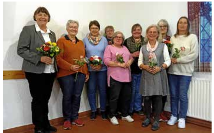
Das neue Vorstandsteam der Güglinger LandFrauen