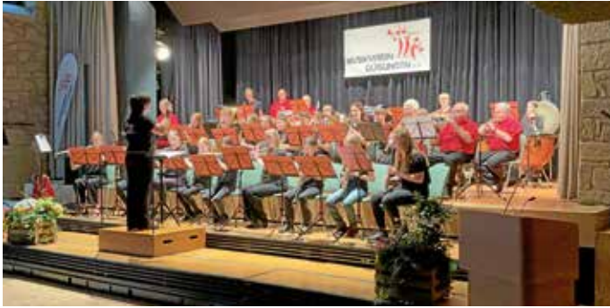
Jugendkapelle und Ü50-Gruppe gemeinsam auf der Bühne

mit „Sousa the marching King“. Anschließend übernahm die ältere Generation und begeisterte mit bekannten Stücken im Stile von James Last oder Glenn Miller.