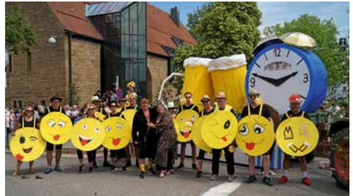
Der Festzug endet für Fußgruppen auf der Festwiese am Festplatz.

In Güglingen steigt die Aufregung: Es sind nur noch zwei Wochen bis zum Pfingstwochenende. Am letzten Tag vor den Ferien könnten die Schüler durch das Maifest beeinträchtigt sein, denn am Freitag ist die Bushaltestelle bereits verlegt, weil auf dem Festplatz die Aufbauarbeiten in vollem Gange sind. Doch die Busfahrer wissen Bescheid und nachmittags nutzen viele Schüler ohnehin die Bushaltestelle am Rathaus.