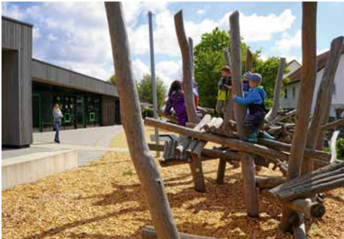
Besonders gern sind die Kinder im Garten auf den tollen Spielgeräten.