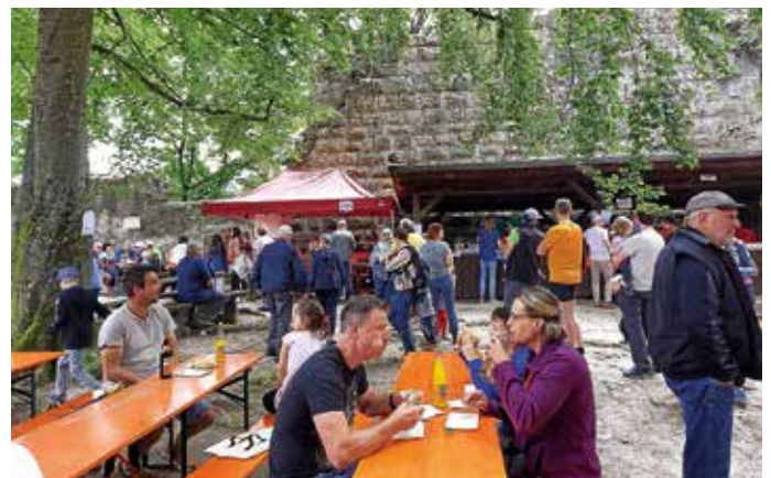
Volles Haus auf der Burg.

Schwacher Samstag, überragender Sonntag würde die Kurzzusammenfassung lauten, wenn es ein Spielbericht wäre. Samstags war uns der Wettergott leider nicht hold und ließ es kurz vor Festbeginn und über den gesamten Morgen hinweg kräftig regnen.