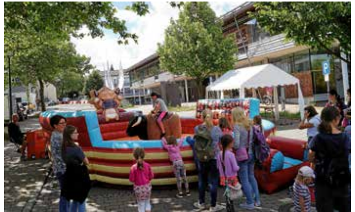
Der Stadtgraben wird am Nachmittag des 5. Juli zur Spielstraße.

Es gibt tolle Spiel- und Bastelangebote, die alle kostenlos sind, wie zum Beispiel eine Bewegungsinsel für Kleinkinder, einen Bobbycar-Parcour, Fangbecherspiel, Barfußpfad, Wurfbude, Schleuderball, Süßigkeiten-Schleuder, Experimente, Wasserolympiade, Bungeerun, Kreiselspiel, Wurfspiel oder eine Lesecke.