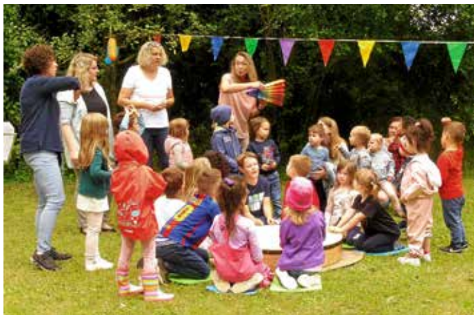
Nach Regen und Gewitter folgt ein bunter Regenbogen

Außerdem gab es tolle Bastelangebote: bunte Flugbälle und eine Rakete aus Strohalmen, die auch so manchen Erwachsenen in Erstaunen versetzte. Ein buntes musikalisches Programm haben die Erzieherinnen gemeinsam mit den Kindern erarbeitet und unter großem Applaus der Anwesenden aufgeführt. Alle Kinder haben kräftig mit gesungen, getrommelt, gerasselt und geläutet.