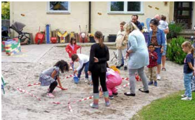
Die kleinen Forscher graben nach Schätzen im Sandkasten

Beim diesjährigen Sommerfest stand alles unter dem Motto „Forscher und Entdecker“. Für Groß und Klein gab es an verschiedenen Stationen allerlei zu entdecken. Wer kann in den Fühlkisten alle Gegenstände erraten? Wer entdeckt – ausgestattet mit einem Fernglas – alle 10 Waldtiere? Wer findet den vergrabenen Schatz?