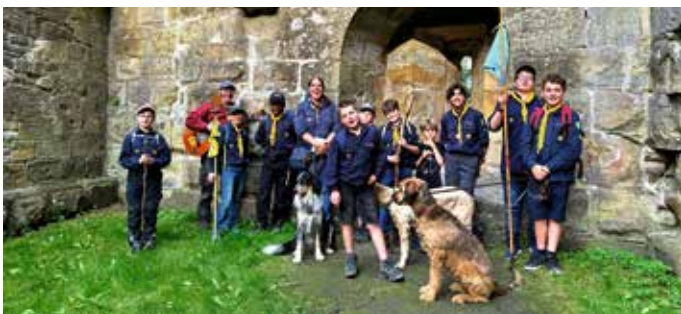
Toller Ausflug der Pfadfinder zur Ruine Blankenhorn.