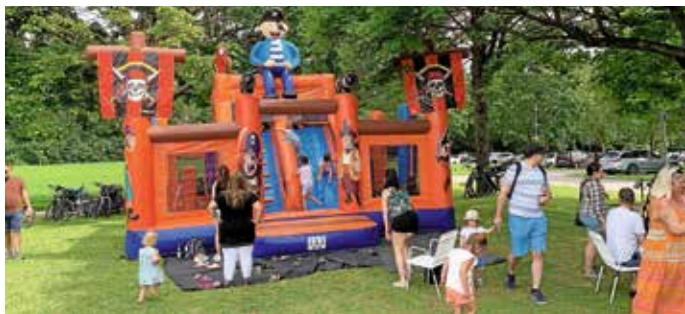
Coole Hüpfburg für die Kleinen

Der Festsonntag begann mit einem Gottesdienst unter Beteiligung des örtlichen Kindergartens in der Riedfurthalle. Die vielen Gottesdienstbesucher sind anschließend bei besten Wetterbedingungen in das Festgeschehen des SVF eingetaucht. Der Andrang auf die angebotenen Getränke und Speisen war groß und auch Kaffee/Eiskaffee und Kuchen wurden gerne angenommen. Unterhalten wurden die Gäste mit flotter Unterhaltungsmusik von den Musikern „Die 3 Richtigen“.