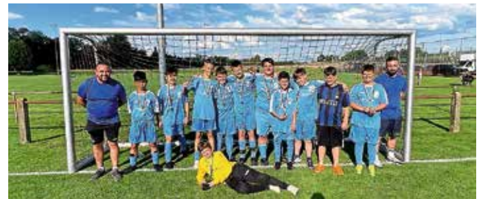
Die D-Junioren der SGM Güglingen – Frauenzimmern