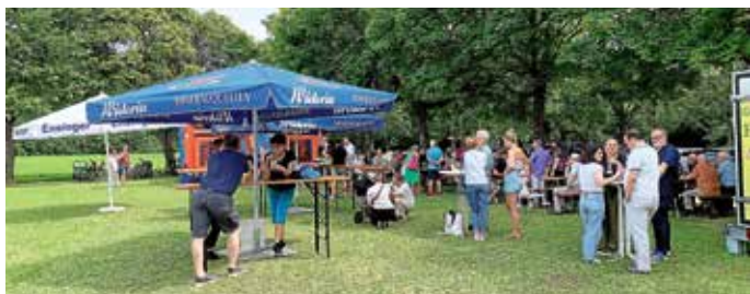
Tolle Gespräche in schöner Atmosphäre

Die Kleinen kamen auf der riesigen Hüpfburg ins Schwitzen und konnten sich richtig verausgaben. Auch dieses Jahr haben die