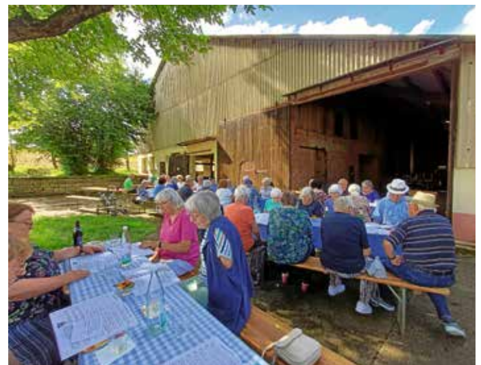
Beginn nach der Sommerpause 12. September

In fröhlicher Runde verbrachten wir einen herrlichen Nachmittag. Nach einem besinnlichen Start haben wir uns gut unterhalten, gesungen und viel gelacht.