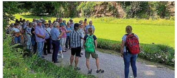
Die Gruppe beim fröhlichen Ausflug.

Vorbei an der dampfenden Killesbergbahn betraten die Ausflugler den Park. Sofort sahen wir „dr Killesberg des isch unser Paradies“. Das Rundfunkfritze hatte recht. Ab 1937 wurden Steinbrüche in ein Erholungsgebiet umgewandelt. Vorbei an Blumenbeeten, Bäumen, Sträuchern, Lamas, Ziegen und Milchbar besichtigten wir den weitläufigen Park. Nach dem Mittagessen und einem Viertele, „kamen sich einige wie zwanzig vor,“ und be-