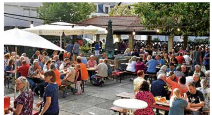
Auf dem Kelterplatz...

Der Kelterplatz vor der Lambertuskirche wird sich am Samstag, 3. August, wieder in einen Wein- und Biergarten verwandeln. Die gemütliche Hocketse rund um den „Stilling-Brunnen“ beginnt um 17.30 Uhr. Angeboten werden Grillwürste, Steak-Weck, Pommes frites und vegetarische Burger. An den Getränkeständen gibt es Nichtalkoholisches, Fruchtsäfte von Pursafta und Wein der Weingärtner Cleeborn-Güglingen sowie ein „Augustiner vom Fass“.