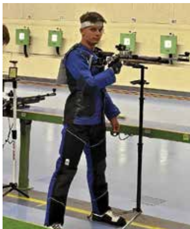
Cornelius im Einsatz