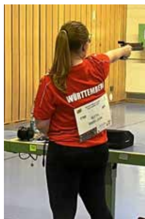
Mailin im Anschlag