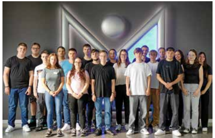
Die Firma Layher begrüßt 20 neue Auszubildende und Studierende.

Zu Beginn des neuen Ausbildungsjahres begrüßt die Firma Layher 20 neue Auszubildende und Studierende. Durchschnittlich absolvieren rund 40 Personen im kaufmännischen, technischen, gewerblichen und IT-Bereich ihre Berufsausbildung bei der Wilhelm Layher GmbH & Co KG. Gut ausgebildete Mitarbeiterinnen und Mitarbeiter mit unternehmensspezifischem Fachwissen sind ein wichtiger Wettbewerbsfaktor für die Firma mit Sitz in Eibensbach. Nur auf diese Weise ist es möglich, eine konstant hohe Qualität zu gewährleisten, was ein wichtiger Bestandteil des Kundenversprechens „Mehr Möglich“ ist.