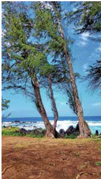
Blick auf den Pazifischen Ozean