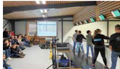
Volles Haus bei den Wettkämpfen