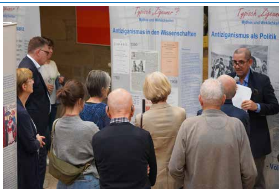
Ausstellung über Flucht und Vertreibung bis 18. Oktober im Rathaus Güglingen