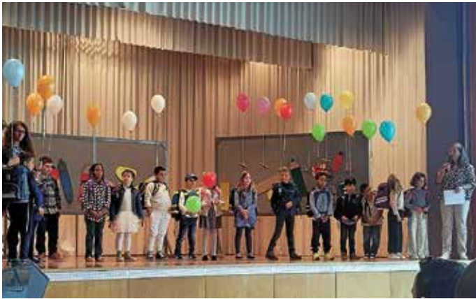
Die Erstklässler mit Wunschballons an ihren Schulranzen.

Die Wartezeit konnten sich die Festgäste bei einem Stehimbiss verkürzen, den die Eltern der zweiten Klassen organisiert haben. Herzlichen Dank an alle, die diesen Fest-Vormittag mitgestaltet haben.