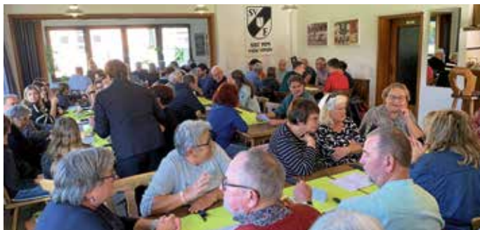
Kirwe 2024 beim SVF

Das traditionelle Kirwe-Essen des SVF war auch in diesem Jahr ein voller Erfolg. An 3 Terminen samstags und sonntags war das Sportheim des SVF wieder gut mit Wildliebhabern gefüllt. Familien und Freunde nutzten die Gelegenheit, um heimisches Wild in geselliger Runde zu genießen.