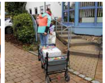
... und beim Abgeben der Päckchen in der Sammelstelle.