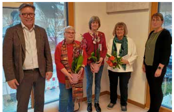
Beim Ehrenamtstag wurden langjährige Engagierte ausgezeichnet.