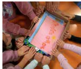
Fleißige Kinderhände beim Packen ...