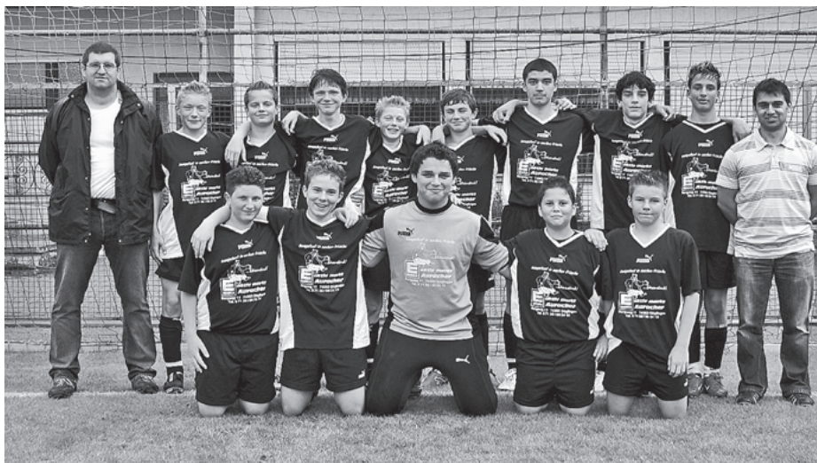
Unser Bild zeigt das erfolgreiche Team des TSV Güglingen

Die Fußballsaison 2006/2007 ist bei den C-Junioren der Kreisliga eigentlich schon „Geschichte“ – doch erst jetzt konnte der Meister in dieser Spielklasse endgültig ermittelt werden.