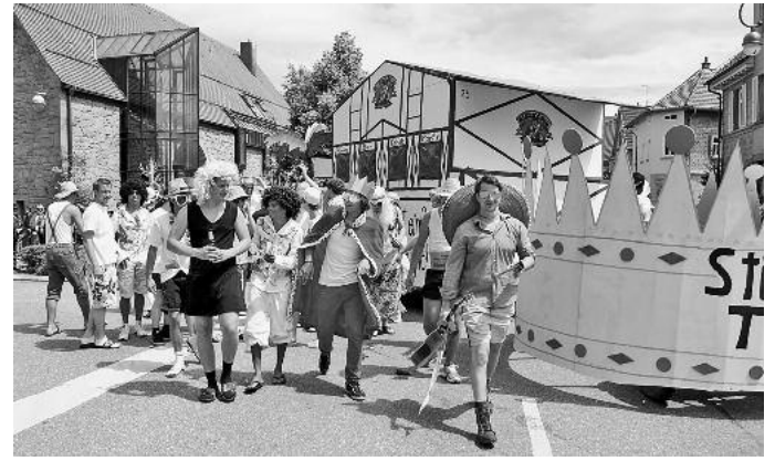
Den wahren König präsentierte der SV Frauenzimmern. Die TSV-Fußballer sagen dem Ballermann Ade und bleiben jetzt lieber zu Hause.