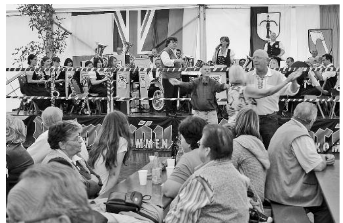
Im Zelt spielte der Musikverein Massenbachhausen auf. Die obligatorisch gute böhmisch-mährische Volksmusik kam wie immer zum Schluss von der Werkkapelle Layher.