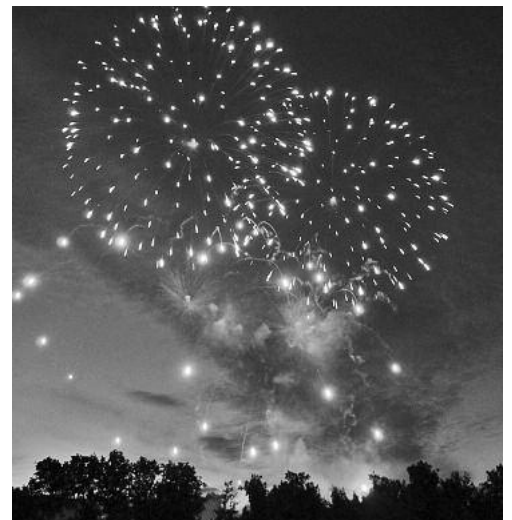
Über alle Festtage war der Vergnügungspark beliebt und ganz zum Schluss ließ man es beim Feuerwerk so richtig krachen.