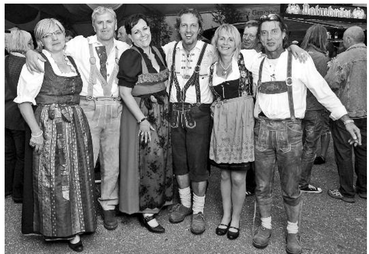
Am Sonntagabend war das „Albsextett“ zu Gast. Man hatte sich dazu „passend gekleidet“ und konnte generell feststellen, dass Dirndl und „Krachlederne“ auch in unseren Breitengraden immer mehr in Mode kommen.