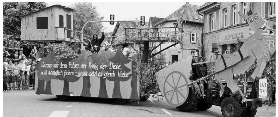
Die ZabergäuNarren Güglingen konnten phon- und personenstark Farbtupfer setzen. Das Bäze-Team vom TSV war auch auf Beutefang.