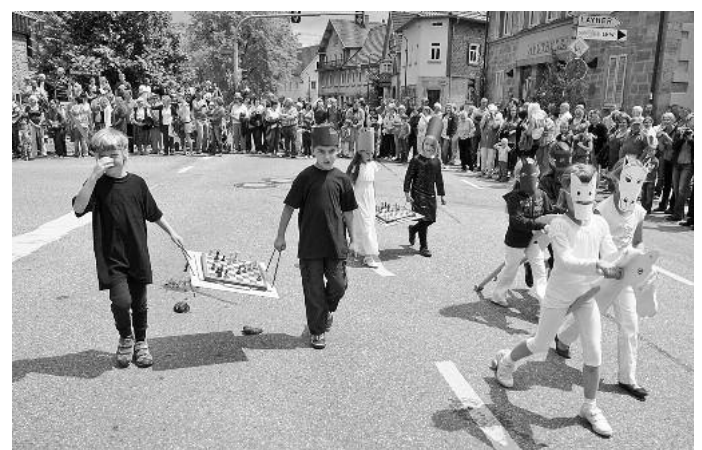
Die Kindertagesstätte „Heigelinsmühle“ zeigte ebenso Flagge wie Grundschüler aus der KKS.