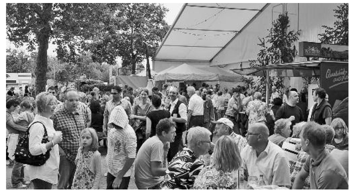
Wie die Motorradfreunde Zabergäu mit steigenden Spritpreisen umgehen wurde zum Schluss des Festzuges gezeigt. Danach gings es eilig zum Festplatz, damit man sich bei (noch) strahlender Sonne beste Plätze ergattern konnte.