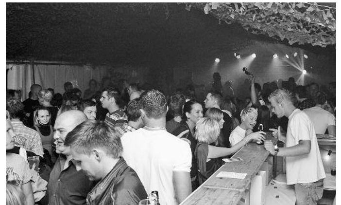
Die Happy Ness-Brass-Band war bei ihrem vierten Gastspiel in Güglingen der Garant für Stimmung von Anfang an. Im Disco-Zelt war aber genauso viel los.