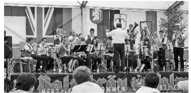
Der Familiensonntag mit dem Kinderprogramm vom „Goisahannes & Rotzlöffel“, die Spielwiese im Zelt und Unterhaltung vom Musikverein Güglingen prägten den Sonntag-Nachmittag.