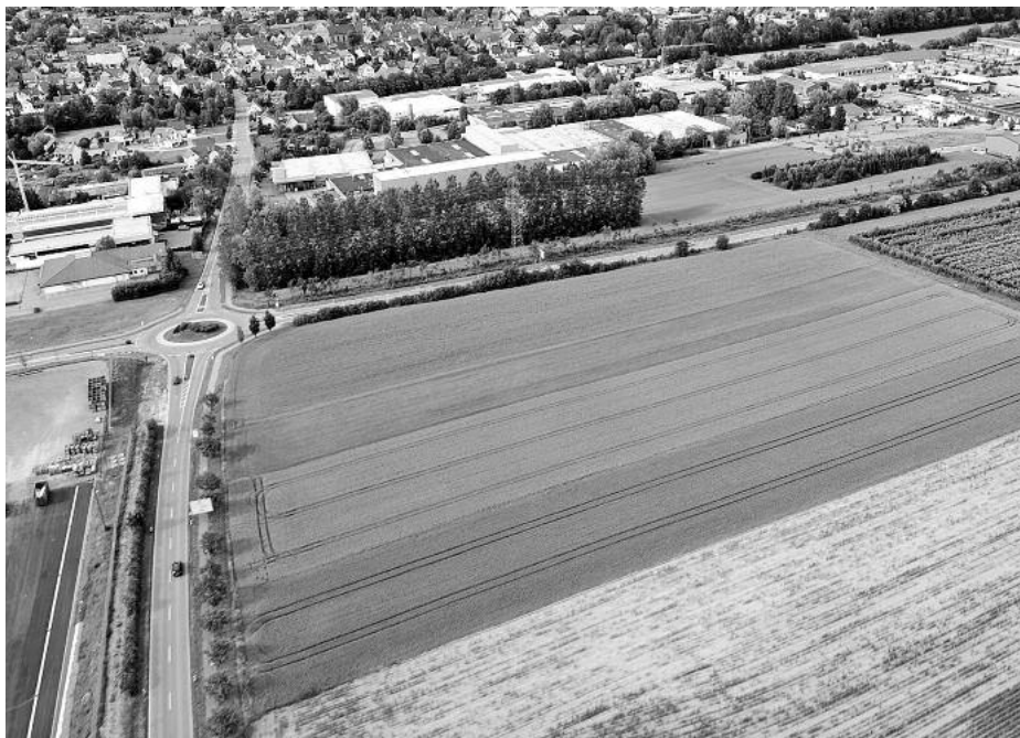
Das Gewerbegebiet „Lüssen“ aus der Vogelperspektive – aktuell aufgenommen am 12. Juni 2011.

Die planungsrechtlichen Voraussetzungen wurden im Textteil klar fixiert. Lagerplätze für Schrott und Abfälle aller Art und Autoverwertungen werden nicht zugelassen. Grundsätzlich ausgeschlossen sind auch großflächige Einzelhandelsbetriebe. In dem von Süden nach Norden abfallenden Gelände sind die Gebäudehöhen zwischen 10 und 12 Meter Höhe erlaubt. Grundstücksentwässerung im Trennsystem (Oberflächen-/Schmutzwasser), das Verbot von wasserundurchlässigem Pflastermaterial im Außenbereich, stellplatzabhängige Baumpflanzungen (5 Stellplätze = 1 standortgerechter Laubbaum), insektenschonende Leuchtmittel bei der Außenbeleuchtung, Pflanzzwang für weitere Büsche und Bäume sind zum Schutz, zur Pflege und zur Entwicklung von Boden, Natur und Landschaft nach den Bestimmungen des Baugesetzbuches festgeschrieben.