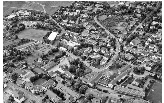
Wer in die Luft gehen wollte, hatte per Hubschrauber Gelegenheit dazu und konnte sich den ganzen Festbetrieb und mehr aus der Vogel-Perspektive anschauen. Knapp 250 Flug-Willige nutzten dieses Angebot.