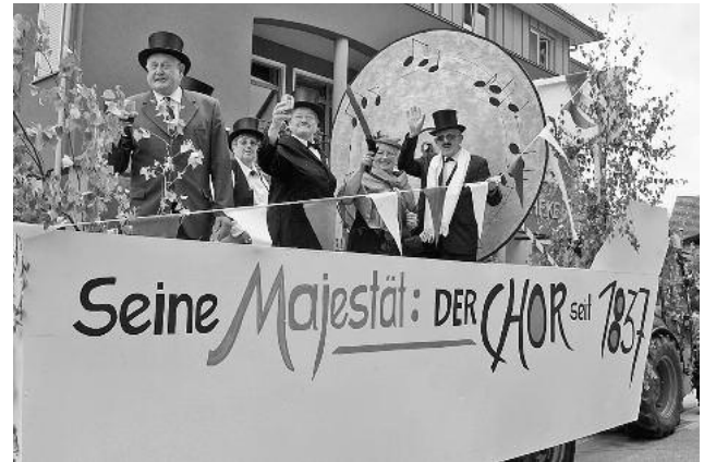
Der Verein „Partner in Europa Güglingen“ hatte Gäste aus Dorking und Auneau eingeladen. Sie marschierten beim Festzug mit und hatten zuvor ein sportlich-unterhaltsames Angebot beim TC Blau-Weiß. Vom Liederkranz Güglingen wurde man auf ein bevorstehendes Groß-Jubiläum aufmerksam gemacht.