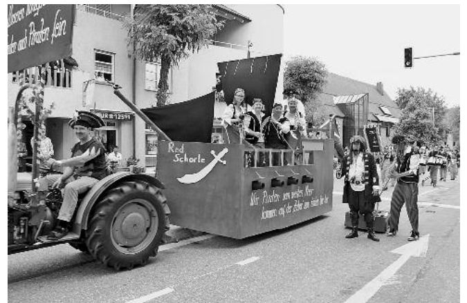
Der Obst- und Gartenbauverein Güglingen präsentierte königliche Genüsse aus der Region. Die Ex-TSV-Theatergruppe war piraterisch unterwegs.