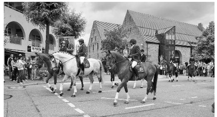
Nach dem Wecken durch den Musikverein Güglingen, den Fanfarenzug des SSV und die Werkskapelle Layher ging es beim ökumenischen Festgottesdienst im Zelt erbauend zu. Dann starteten die Festreiter vom Reitclub Güglingen den traditionellen Festzug – dieses Jahr unter dem Motto „Güglinger Maifest – einfach königlich“. 28 Beiträge haben es verdient, vorgestellt zu werden.