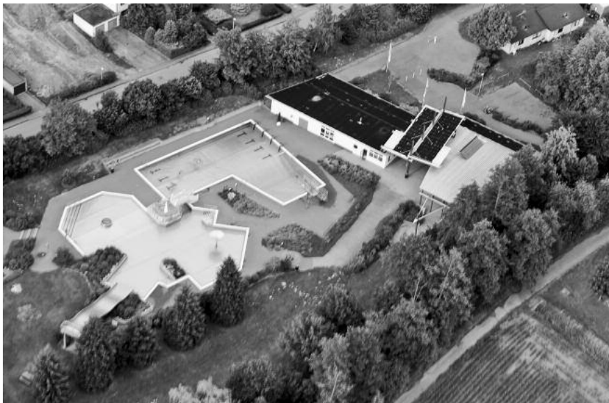
Wenn das Wetter mitmacht – wie wäre es mit einem Freibadbesuch?