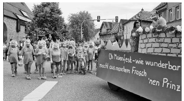
Bei der Bürger-Union war man lokalpolitisch unterwegs. Die Frauen der TSV-Gymnastik waren unter Froschmasken nicht zu erkennen, hatten dafür aber einen mächtigen Frosch-König.