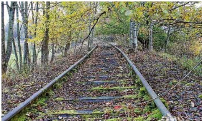
Schiene frei – Zukunft Stadtbahn

Am Samstag, 15. Februar, gibt es eine weitere Veranstaltung zur Reaktivierung der Zabergäubahn.